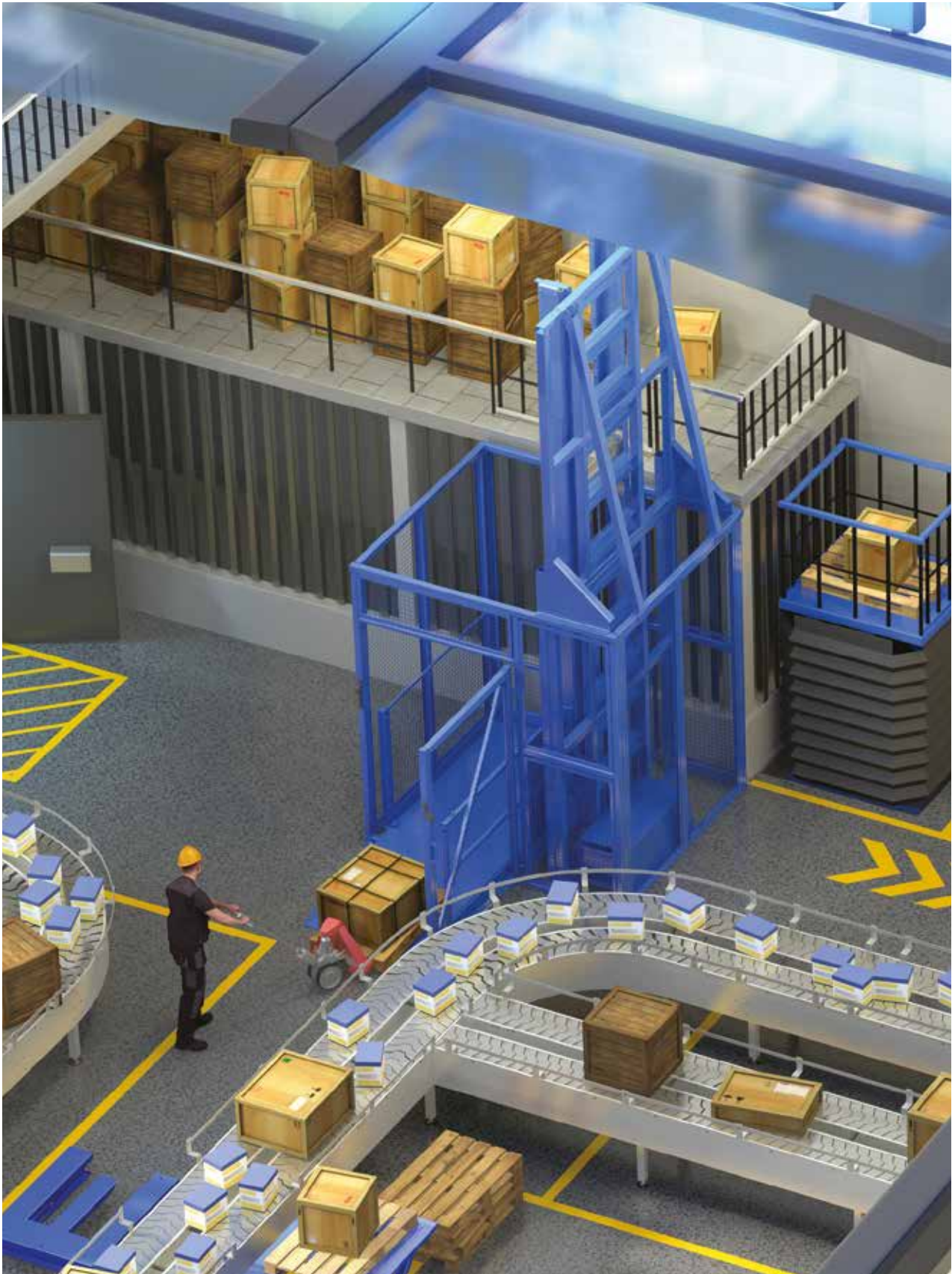
Elevadores de columna (MDL)